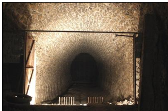
Le pas des cibles du stand de tir à 100 m A l'arrière-plan, le mur terminal qui ferme le tunnel