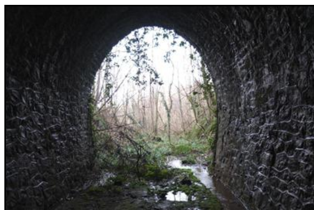
L'entrée du souterrain vue de l'intérieur avec le chemin d'accès au stand de tir