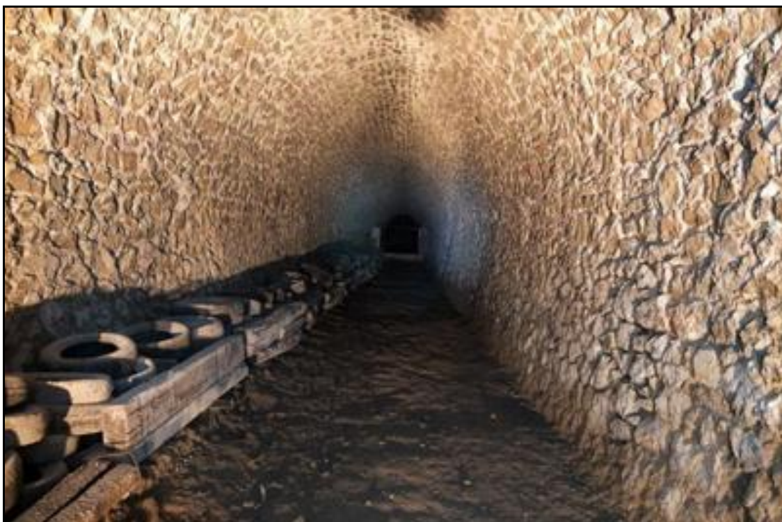
Le stand de tir à 100 m Au fond, le pas des cibles