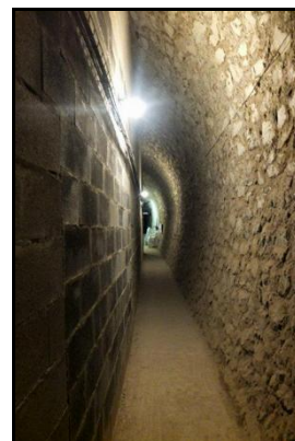
Le stand de tir à 25 m qui fait suite au premier, et le passage latéral qui permet de le longer