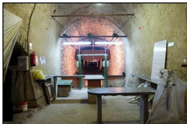
Après les deux premiers stands de tir latéraux, débouché sur le troisième et dernier stand qui occupe toute la largeur de la galerie dans la grande ligne droite qui termine le tunnel