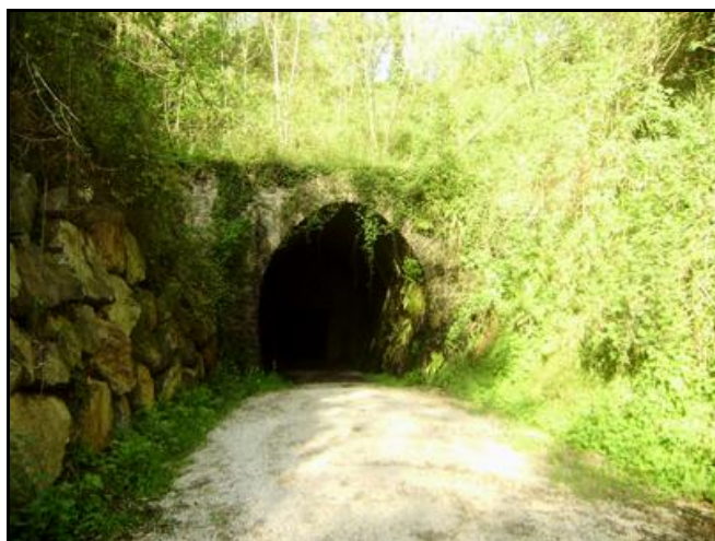
Ci-contre, l'entrée du tunnel au fond d'une longue tranchée ébouleuse