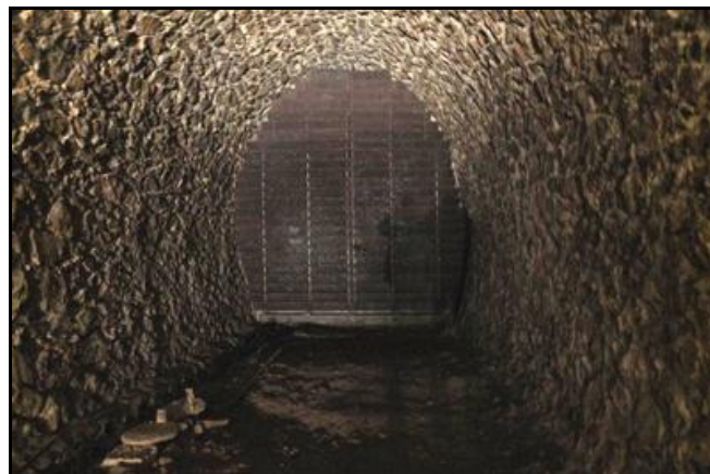
Le mur terminal recouvert de son récupérateur de projectiles métallique